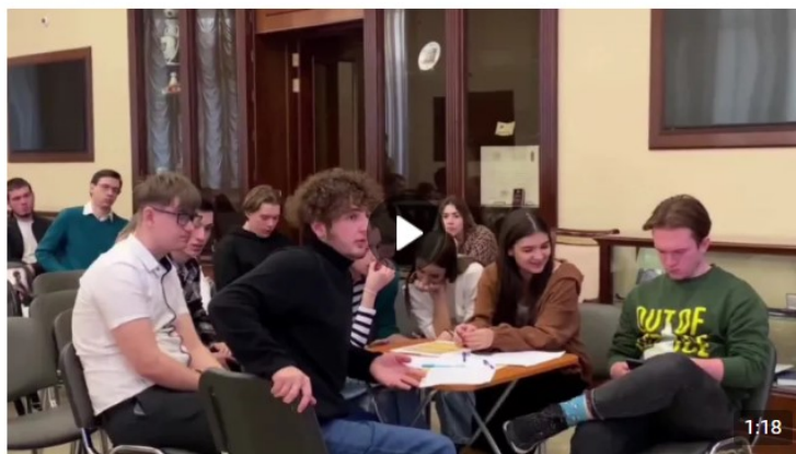
Дебаты «Идеология радикальных организаций» 1 888 просмотров

В рамках дебатов можно: развенчивать мифы, декларируемые представителями радикальных идеологий для вербовки; развивать навыки критического мышления и ведения дискуссии; формировать в целом антитеррористическое сознание и активную гражданскую позицию. Рекомендуется для мероприятия вовлекать не более 20 человек (см. рисунок 5).