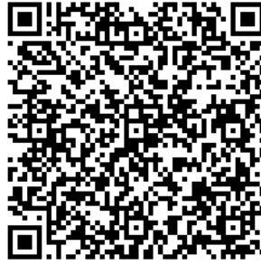
Рисунок 7 — Сценарий тематической викторины с примерами вопросов

В каждом из перечисленных мероприятий важно отслеживать активность участников, высказываемыми ими мнения, их настрой в целом. На таких мероприятиях необходимо присутствие психолога для фиксации активности и оценки их поведения.