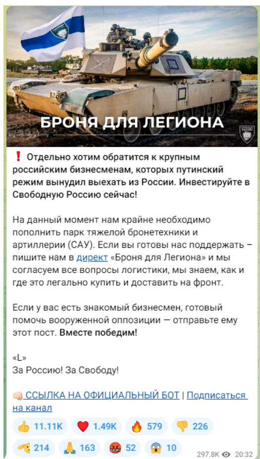
Рисунок 3 — Скриншот телеграм-канала легиона «Свобода России» с призывом к финансированию

Важно подчеркнуть, что помимо собственно пропаганды и распространения идеологии террористических организаций, а также вовлечения в деятельность террористических организаций существует еще одна угроза террористического характера — ложные сообщения о готовящемся террористическом акте. Только за 2021 год зафиксировано более 4,5 тысяч ложных сообщений о готовящихся терактах на объектах социальной инфраструктуры. Это может быть хулиганство, злой умысел, специфическое чувство юмора, желание проверить качество работы правоохранительных органов или антитеррористическую защищенность объекта и др. Во всех вышеперечисленных случаях за такой поступок придется нести уголовную ответственность. Ведь злоумышленник нарушает конструктивную деятельность общественных объектов, а правоохранителям приходится задействовать множество средств и сил, чтобы проверить объекты, которые якобы находятся под угрозой. За ложное сообщение о готовящемся теракте правонарушитель может быть наказан либо штрафами – от 200 тысяч рублей и до двух миллионов рублей, либо лишением свободы – от одного года до 10 лет. Ответственность за данный вид правонарушения наступает с 14 лет (статья 207 УК РФ «Заведомо ложное сообщение о акте терроризма»).