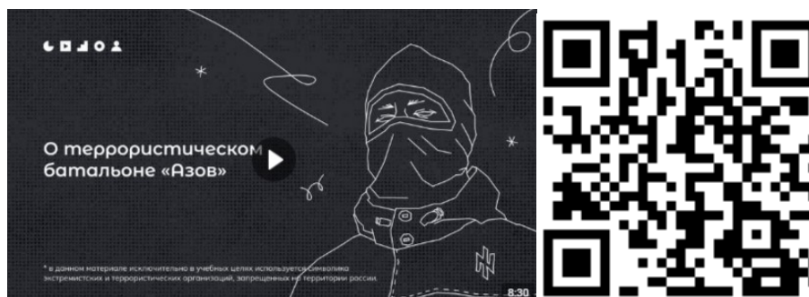
Рисунок 2 – Видеоролик, разъясняющий причины признания организации террористической

3) батальон «Азов» (см. рисунок 2) — военизированное подразделение, созданное в 2014 году на базе футбольных ультрас и праворадикалов Харькова и некоторых других украинских регионов. «Азовцы» причастны к массовым военным преступлениям против мирного населения Донбасса и Украины. Сама организация признана террористической в России по решению Верховного Суда Российской Федерации от 02.08.2022 г. № АКПИ22-411С. Батальон «Азов» входит в состав Национальной гвардии, подчиненной Министерству внутренних дел Украины. С 2014 года боевики батальона «Азов» систематически пытали, убивали и грабили мирных жителей ДНР, ЛНР и востока Украины. У батальона неонацистская идеология. Это проявляется в расизме, русофобии, восхвалении наследия Третьего рейха и украинских коллаборационистов в годы Второй мировой войны. Среди боевиков в том числе распространены радикальные неоязыческие взгляды. Свою идеологию боевики активно распространяют среди украинской молодежи через лагеря подготовки, печатную продукцию (комиксы, книги) и интернет-сообщества. С «Азовом» активно сотрудничает большое количество праворадикальных течений на Украине (признанных в России экстремистскими организациями), например, «Правый сектор», «УНА-УНСО», организация «Тризуб им. Степана Бандеры» и т.д.